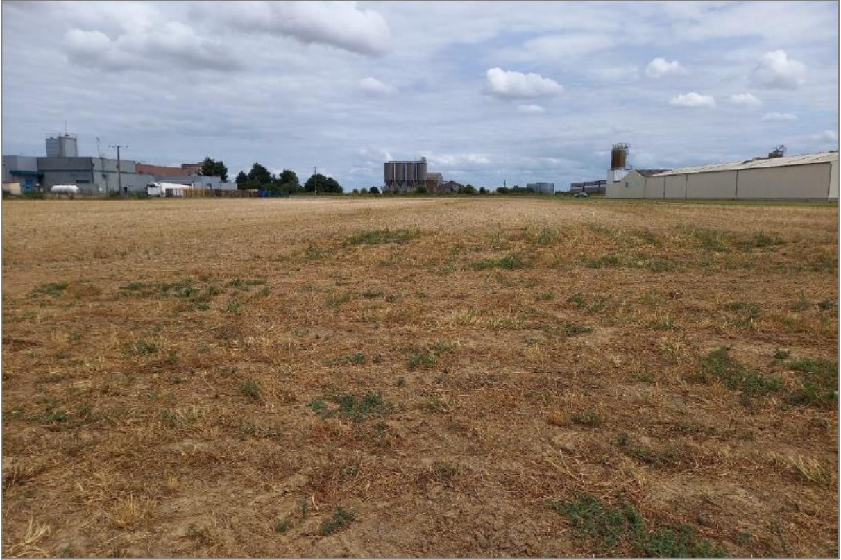
Vue du site du projet depuis la bordure Ouest